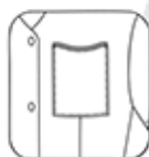
Poche poitrine avec passepoil contrasté