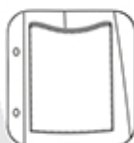
Poche basse avec passepoil contrasté