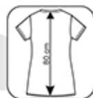
Hauteur milieu dos